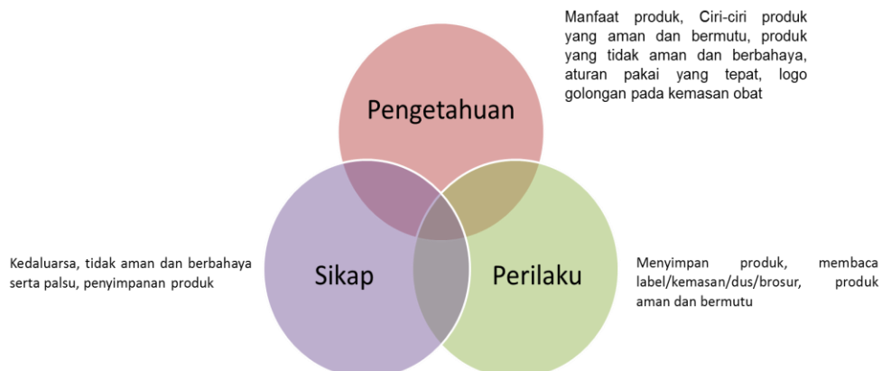
Gambar 3.1 Definisi Kerangka Berfikir Penilaian Indeks Kesadaran Masyarakat Terhadap Obat dan Makanan

Indeks kesadaran Masyarakat merupakan ukuran kesadaran masyarakat terhadap Obat dan Makanan menggunakan pendekatan AIDA ( Awareness, Interest, Desire, Action ) untuk mendapatkan informasi mengenai kesadaran, ketertarikan, keinginan dan tindakan sebagai pengambilan keputusan dalam memilih obat dan makanan. Dalam melakukan survei kesadaran masyarakat, Badan POM memiliki tiga indikator sebagai dasar penilaian yaitu pengetahuan, sikap, dan perilaku.