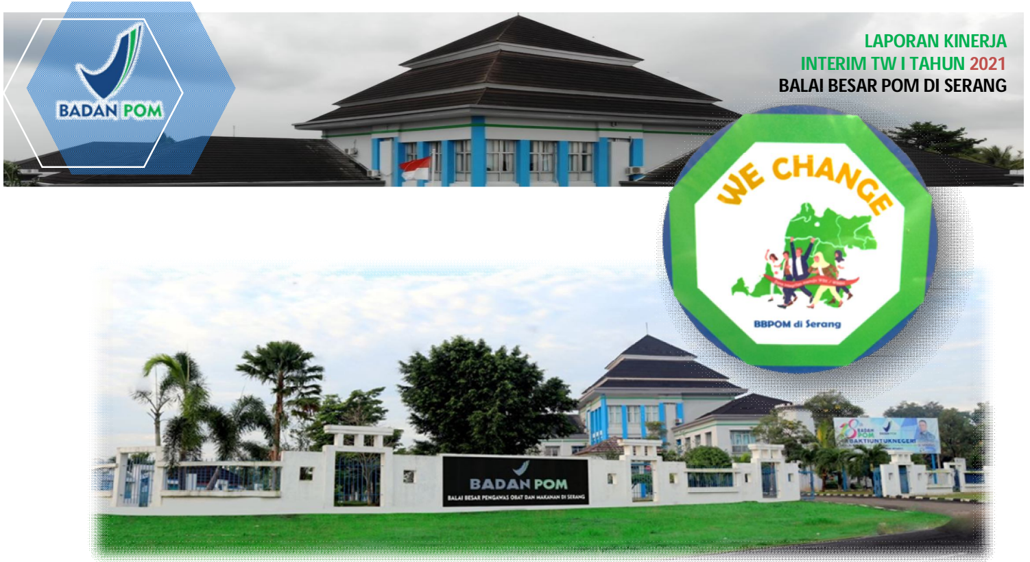
Gambar 1.1 Kantor Balai Besar POM di Serang